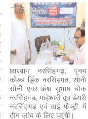
डीआर संबाददाता अशोकनगर

मिलावट पर नकल कसने खाद्य एवं औषधि प्रशासन विभाग द्वारा जिले में दूध और दूध से निर्मित पदार्थों सहित बर्फ की फैक्ट्री दुकानों का औद्योगिक निरीक्षण किया जा रहा है। इसी कड़ी में कल रविवार को कोल्ड ड्रिंक, आइसक्रीम, दही की जांच की गई। जांच के दौरान नरसिंगढ़ स्थित अग्रवाल स्वीट्स सुभाष चौक नरसिंगढ़, मन्नु एवर ब्रेड