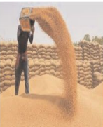
बेचने के लिए सरकारी खरीदी केंद्रों पर रजिस्ट्रेशन कराया है। यहाँ पर किसानों से 2625 रूपय प्रति किंवांटल के हिसाब

भोपाल। नौ दिन देशी के बाद गुरुवार से गेहूँ खरीदी शुरू हो जाएगी, जिसके लिए बुधवार को किसानों के रोलॉट बुकिंग का पोर्टल ओपन किया गया। जिसके तहत एक दिन में 1980 किसानों ने खरीदी केंद्रों पर गेहूँ बेचने का रोलॉट बुक कराया, जिसके तहत गुरुवार को सबसे पहले साइलेंट केंद्र पर खरीदी शुरू होगी। इसके बाद शुक्रवार से सभी केंद्रों पर खरीदी शुरू होगी। इस बार 37 हजार 700 किसानों ने गेहूँ