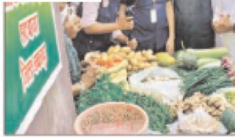
उन्नत बीज प्रसंस्करण, औषधीय पौध प्रजाति, खाद्य प्रसंस्करण एवं उन्नत कृषि फसलों की प्रदर्शनी का अवलोकन भी किया

कार्यक्रम में 10 कृषि स्टार्टअप को 10 करोड़ से अधिक की स्वीकृति दी गई