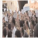
कोर्ट में रिज्यू पीटीशन दाखिल नहीं करती, तो आंदोलन दोबारा शुरू होगा।