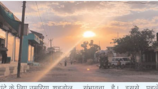
घंटे के लिए उमरिया, शहडोल, सिवनी और बालाघाट जिलों में अलर्ट जारी किया है। इन क्षेत्रों में तेज हवाओं के साथ बारिश और बिजली गिरने की

भोपाल। मध्य प्रदेश में 10 अप्रैल से तेज गर्मी का दौर शुरू होने जा रहा है। भारतीय मौसम विभाग (इस) भोपाल के अनुसार, अगले कुछ दिनों में दिन के तापमान में 5 से 6 डिग्री सेल्सियस तक बढ़ोतरी दर्ज की जा सकती है। हालांकि, गुरुवार को मौसम का मिजाज पूरी तरह मग्न नहीं रहेगा और कई जिलों में बारिश, आंधी और गरज-चमक देखने को मिलेगी। मौसम विभाग ने अगले 24