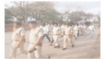
डॉ. अनाथशाला में विदिशा

विदिशा जिले के सिरोंज में मल्लान जाद के अपहरण और मारपीट मामले में पुलिस ने पांच आरोपियों को गिरफ्तार किया है। 8 मई की रात हुई इस घटना के बाद पुलिस ने गुजरात को आरोपियों का जुलूस निकालने के लिए उन्हें न्यायालय में भेज दिया, जहां से सभी को जेल भेजा गया। पुलिस के अनुसार आरोपियों में मल्लान जाद का अपहरण कर उनके साथ गौरी मारपीट की थी। जाद अपहरण में उनके पहले स्थानीय अपहरण के जाद गया, जहां से अज्ञात गौरी भेजे गए। विदिशा जिले अपहरण केरुत किया गया। घटना के विरोध में जाद समाज के लोगों ने देर रात तक जाद का घेराव कर आरोपियों की गिरफ्तारी की