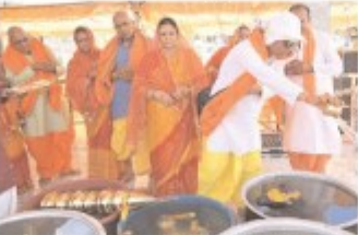
शहर के मनीषाकर निवास श्रीराधेश्याम विहार कालोनी में पांच दिवसीय प्राण प्रतिष्ठा महोत्सव का आयोजन किया जा रहा है।