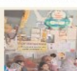
ग्राम स्वास्थ्य और पोषण विक्स पर शिविर लगाकर किया 1149 बच्चों का टीकाकरण।

श्रीआर संवाददाता-सीहोर। ग्राम स्वास्थ्य और पोषण विक्स पर शिविर लगाकर किया 1149 बच्चों का टीकाकरण।