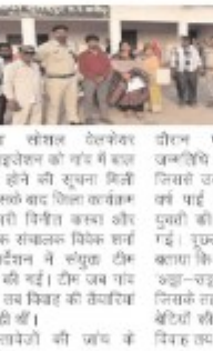
डॉ. अनाथशाला में विदिशा

जिले के गुरुवार रात में गुरुवार को प्रशासन, सिरोंज एवं बाल विवाह विभाग, पुलिस और सामाजिक संगठन की संयुक्त कार्रवाई में एक बाल विवाह रुकवाया गया। रात में अज्ञात-अज्ञात बाल विवाह प्रथा को रोकना तीन जिलों की शादी रुकवाया जा रही थी, जिसमें एक लड़का नाबालिग था। बाल विवाह के बाद सभी परिवारों में विवाह कार्यक्रम स्थगित कर दिए। जांचकर्ता के अनुसार,